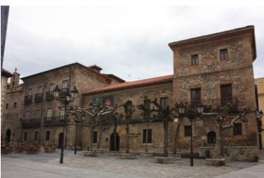
Palacio de Jovellanos