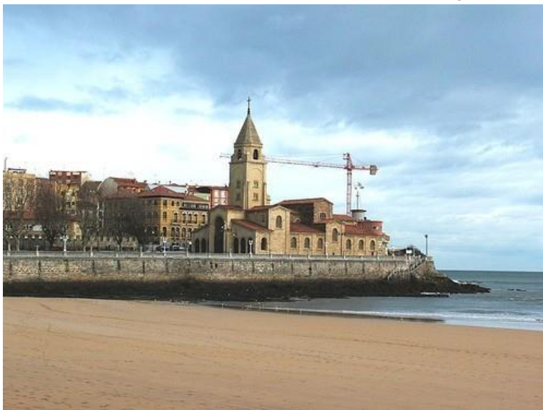
Iglesia de San Pedro

Al final del parque se encuentra el estadio de fútbol del Molinón. Al otro lado del río podemos visitar el etnográfico Museo del Pueblo de Asturias .