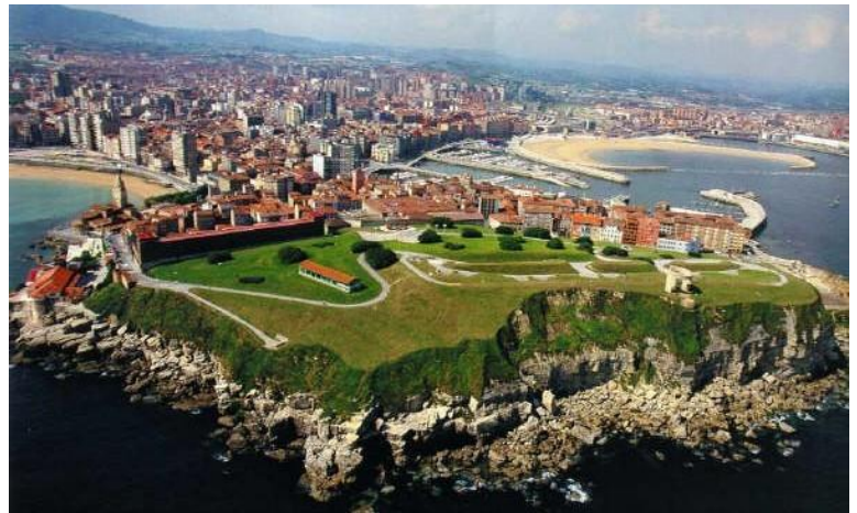
Cerro de Santa Catalina

Al lado del palacio está la capilla de Nuestra Señora de los Remedios, donde reposan los restos de Jovellanos. Anexo queda también el antiguo Hospital de Peregrinos, hoy restaurante.