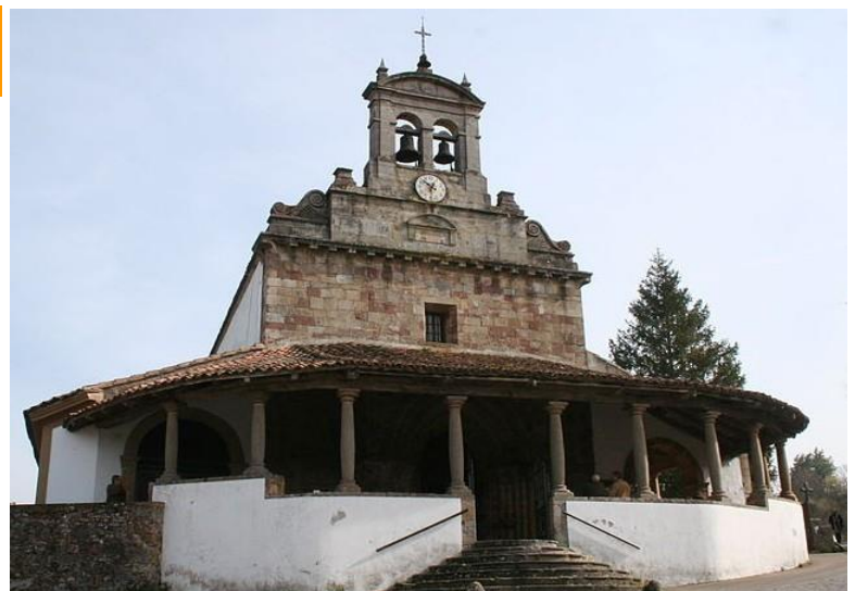
Iglesia de San Juan de Amandi

Verano: L a D de 11 a 13 y 17 a 20. Resto del año: llaves en el pueblo, contactar con Sandalío: 985976925. Culto: D a las 10:30.