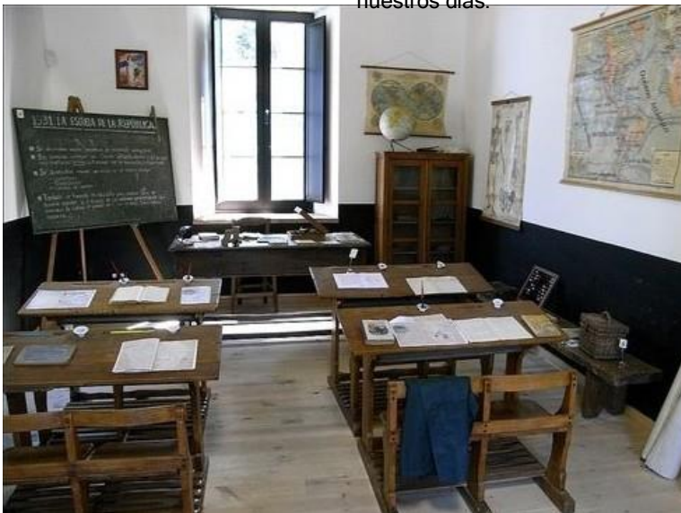
Museo de la Escuela

El edificio fue construido en 1908, con capacidad para 120 alumnos y alumnas y casa para los maestros. A través de una colección de mobiliario y material escolar que data de 1911 hasta 1970, el museo ofrece un recorrido por la historia de la educación en Asturias.