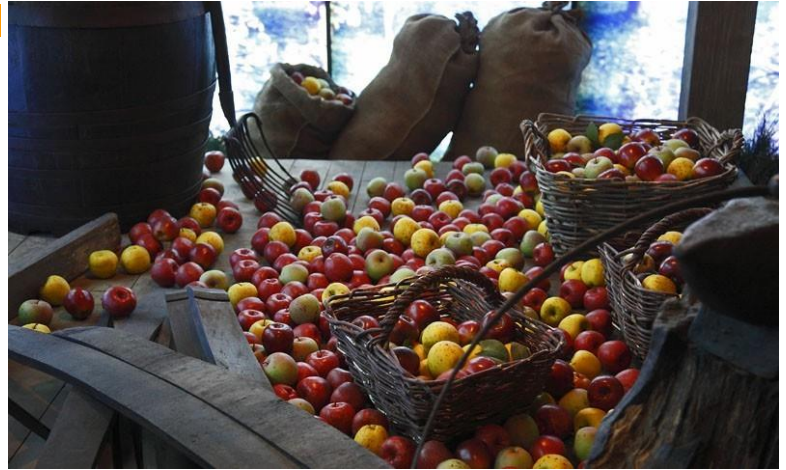
Museo de la Sidra

La visita se puede combinar con el recorrido guiado por las Bodegas de Sidra El Gaitero, junto a las que se encuentra la Colección Permanente de "El Gaitero", con pinturas, fotografías y manuscritos antiguos de la historia de la casa.